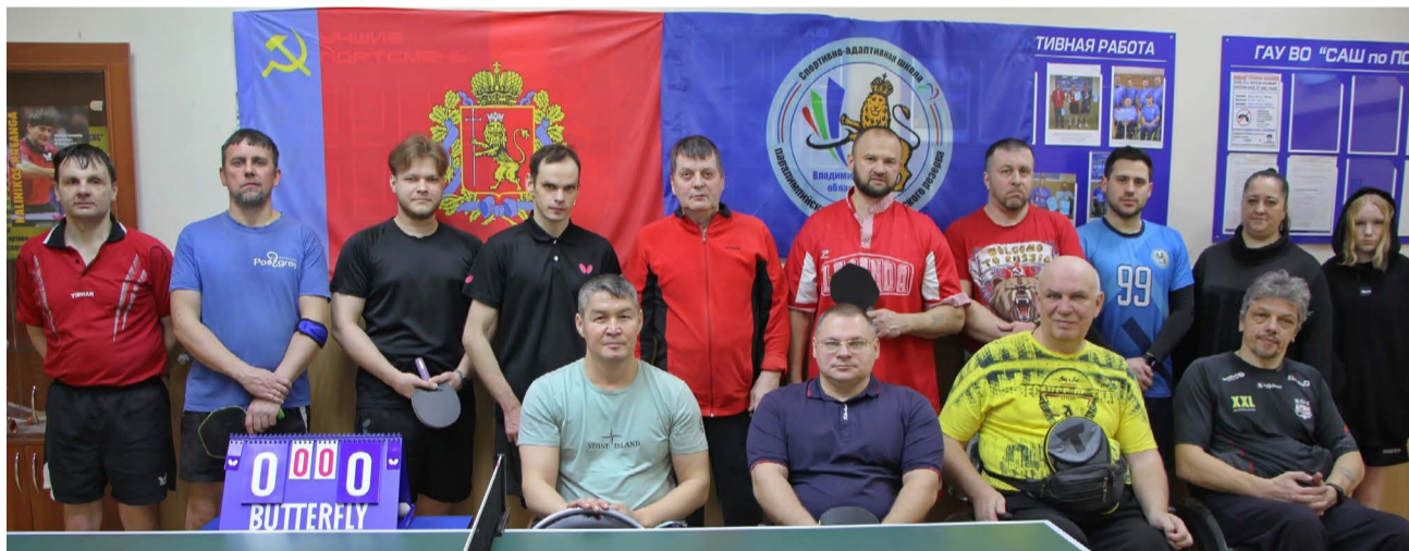
Участники чемпионата Владимирской области по настольному теннису среди лиц с ПОДА.

14 февраля в спортивной школе паралимпийского резерва прошел чемпионат Владимирской области по настольному теннису среди лиц с поражением опорно-двигательного аппарата (ПОДА). Спортсмены посвятили его Дню защитника Отечества. Этот турнир стал настоящим праздником спорта, возможностью спортсменам из Владимирской области проявить свои спортивные навыки.