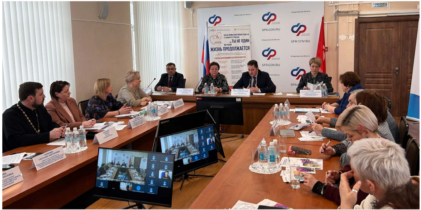
Участники круглого стола в рамках проекта «Жизнь продолжается-2».

...Мужчине, потерявшему мобильность, срочно требовалось обследование и переосвидетельствование, врач отказывался приходить к нему на дом уже несколько лет. А ситуация ухудшается, лекарства не помогают – теперь понятно, что необходимо подключить представителей медицинских страхо-