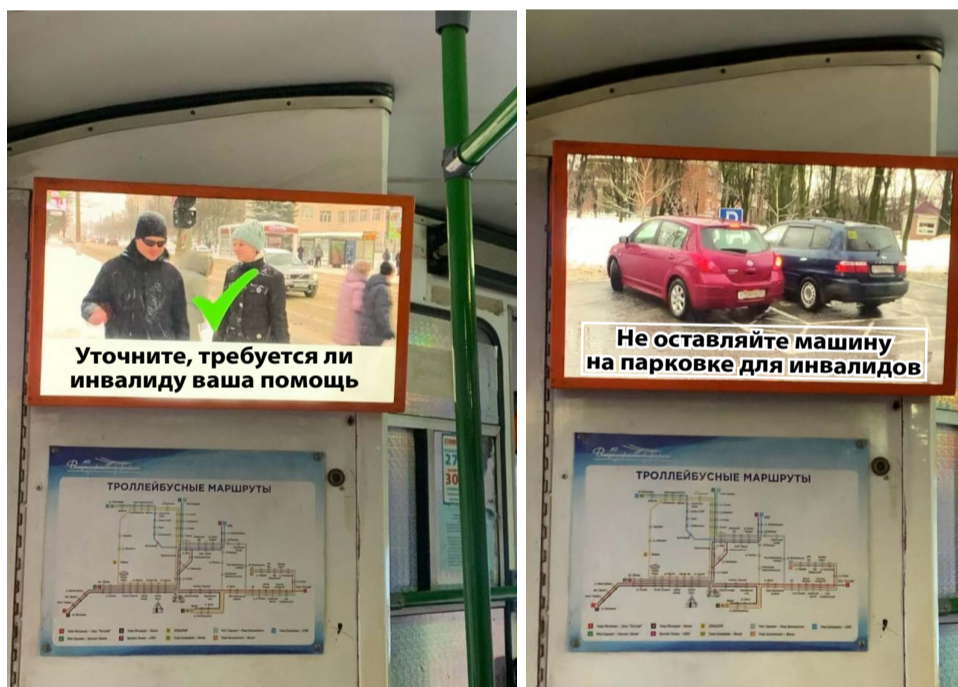
Ролики, рассказывающие о правилах взаимодействия с людьми с инвалидностью, показывают в общественном транспорте г. Владимира.

Проект «Дружелюбная среда - профилактика трудных жизненных ситуаций» реализуется ВООО ВОИ при поддержке Министерства внутренней политики Владимирской области.