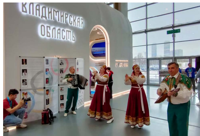
Выступает музыкальный коллектив «Напевы Ополя».