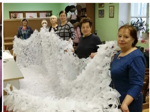
Такие маскировочные сети плетут в Коврове.

Во Владимирской области такая помощь оказывается повсеместно, один за другим отправляются гуманитарные грузы нашим защитникам. Участвует в сборе гуманитарной помощи и Владимирское общество инвалидов, его районные отделения на местах. Желание помочь у всех очень большое, помощь оказывают самую разную.