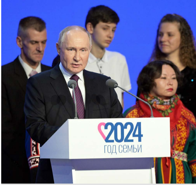
Президент России Владимир Путин.

«Главное предназначение семьи – это рождение детей, продолжение рода, а значит, продолжение нашего народа, нашей многовековой истории. В семье укоренены наша культура, идентичность, национальный характер. Семья учит, воспитывает, передаёт традиции, знания, в том числе и профессиональный опыт. Укреплению института семьи, повышению престижа материнства и отцовства, всесторонней защите детства, демографическим программам мы, конечно же, будем уделять и дальше первостепенное, как я уже говорил, внимание. И хочу подчеркнуть, для нас это не просто ключевое направление развития страны, работы всех уровней власти. Это важнейшая часть нашего суверенного мировоззрения, наше видение будущего нашего народа», – отметил Владимир Путин.