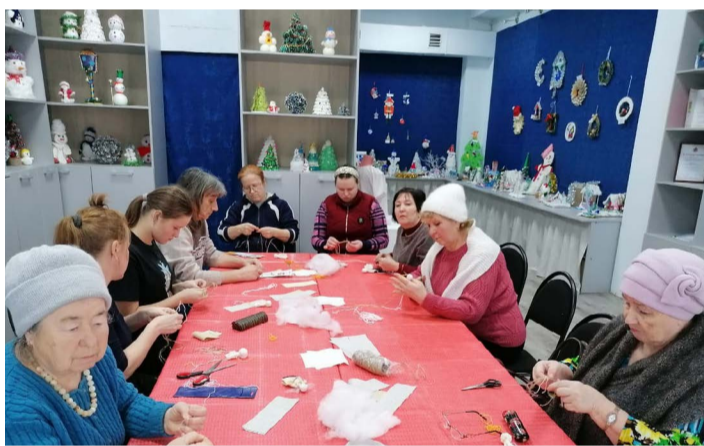
Активисты Вязниковской организации не только вяжут носки, но и делают обереги для наших солдат.

руководитель проекта «Дружелюбная среда - профилактика трудных жизненных ситуаций».