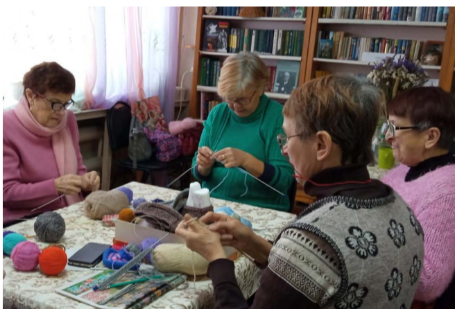
Вот так, собираясь вместе, вяжут носки члены Гороховцевской организации.