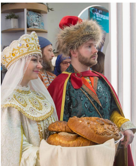
День Владимирской области на ВДНХ открыл Губернатор Александр Авдеев. Гостей встречали тепло и радушно.