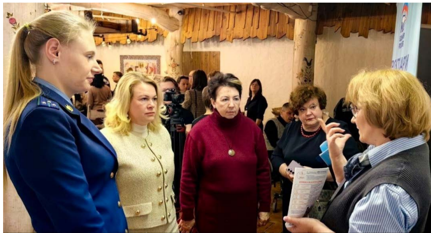
Участникам форума всегда было, что обсудить.