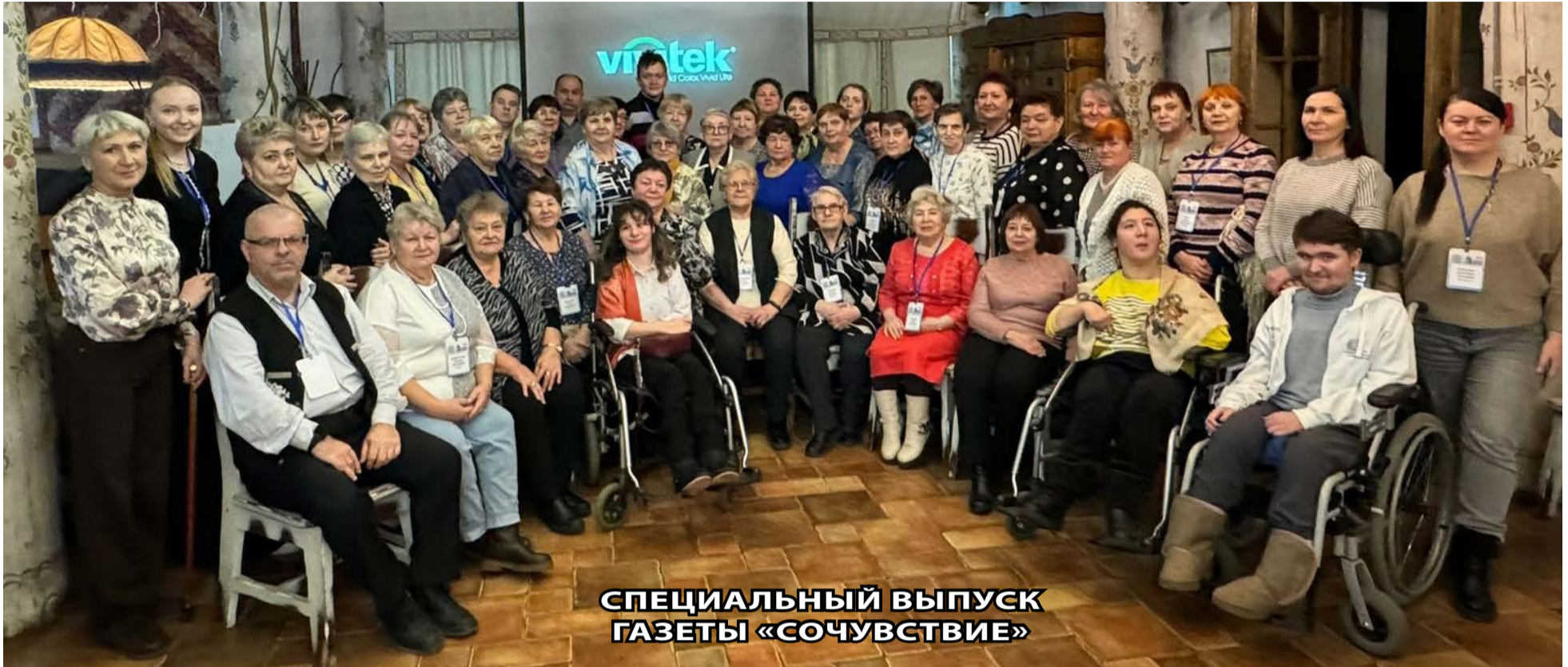
СПЕЦИАЛЬНЫЙ ВЫПУСК ГАЗЕТЫ «СОЧУВСТВИЕ»