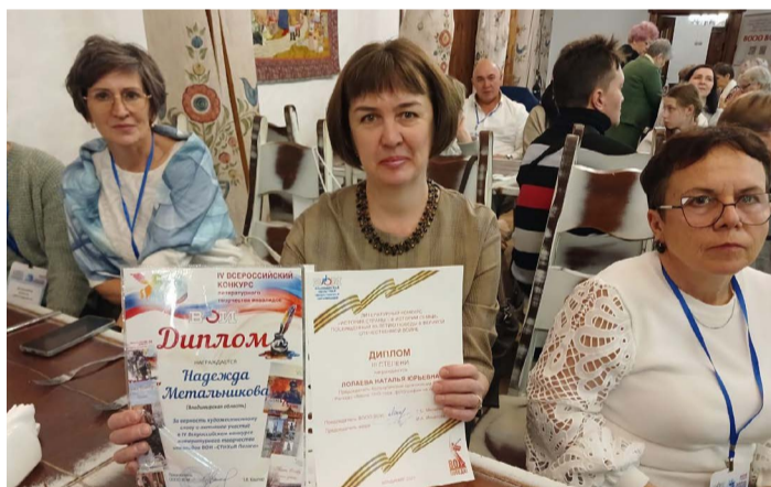
На форуме состоялось награждение активистов и призеров творческих конкурсов ВООО ВОИ.