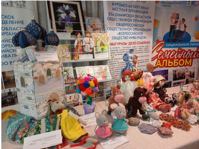
Фрагмент выставочной экспозиции.